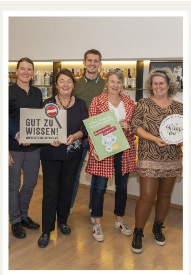
frauenanderskompetent Salzburg, Salzburg