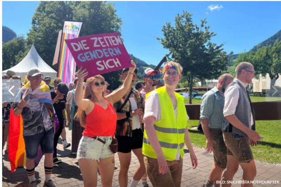
Trotz Hitze kamen viele Besucher

Trotz Hitze kamen Samstag Nachmittag viele zur zweiten Regenbogenparade in den Pinzgau.