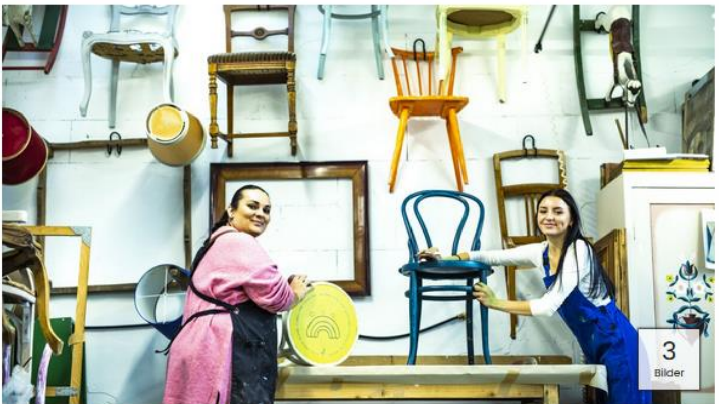
SÖB: "Funkelnaget" eine Upcycling-Werkstatt. Hier können Frauen, bis zu einem Jahr, angestellt werden.