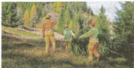
Auszubildende des Campus Oberrain bei der Christbaumernte.